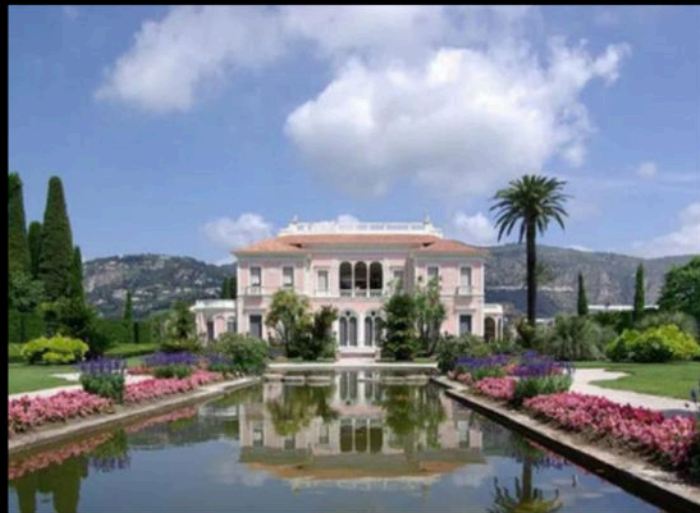
Tour Villa Ephrussi de Rothschild's rooms to see the art collections, then head to the gardens.