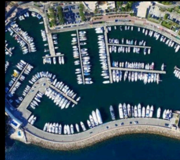
The Marina view

Beaches Hikes Marina & Boat Trips Villa Ephrussi de Rothschild