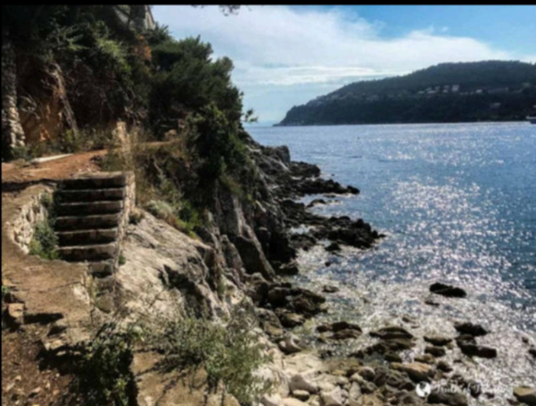
Hike the Saint-Jean-Cap-Ferrat Coastal Pathway which is about 6 km.

Beaches Hikes Marina & Boat Trips Villa Ephrussi de Rothschild