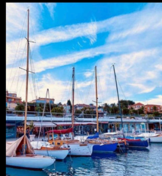
Visit the Marina for boat trips