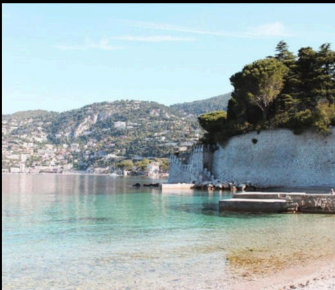
Facing the bay of Villefranche, the Passable Beach has preserved its wild. This mythical place with lush vegetation is only 8 minutes away on foot.