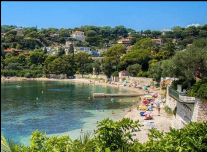
The beaches of Cap Ferrat can be found in small coves along the coastal walking path.